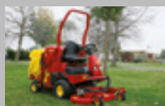
GTS 22-23 hp