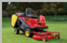
GTR 16-20 hp