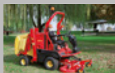
GT 28 hp