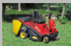
GTM - GSM 15,5-16 hp