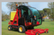
TURBO 1-1W-2-4 28-44 hp