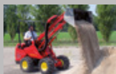
TURBOLOADER 22-36 hp