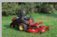
TURBO Z 23 hp