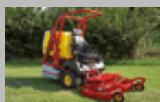
TURBOGRASS 22-23 hp