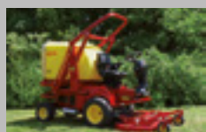
PG - SR 22-28 hp